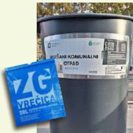
MIJEŠANI KOMUNALNI OTPAD

Odlaze se u ZG vrećicu samo ono što nije korisni otpad : vrećice iz usisavača, higijenski papir, vlažne maramice, zaprljani ili premazani voštani papir (npr. papirmati ubrusi, papir iz mesnice, papir za pečenje kolača), računi iz dućana od termo papira, ostaci termički obrađene hrane (meso, riba, kuhano povrće) i kosti, manje igračke, opušci, britvice za brijanje, izmet i pijesak za kućne životinje.