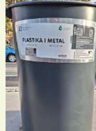
PLASTIKA / METAL

Odlazu se suhe i čiste novine, časopisi, prospekti, katalogi, bilježnice, mape i fascikli, kalendari, papirna – kartonska ambalaža.